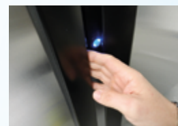
Ouverture électrique par simple effleurement (Gamme 600x800) Electrical opening thanks to light touch (600x800 range)