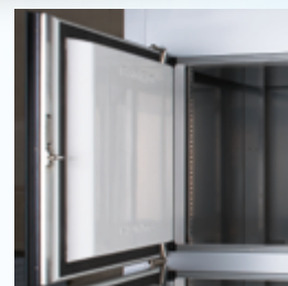
Contre-porte en ABS thermoformée ABS thermo shaped inner door